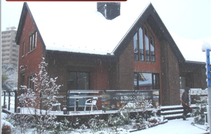
近代ホーム 200年住宅