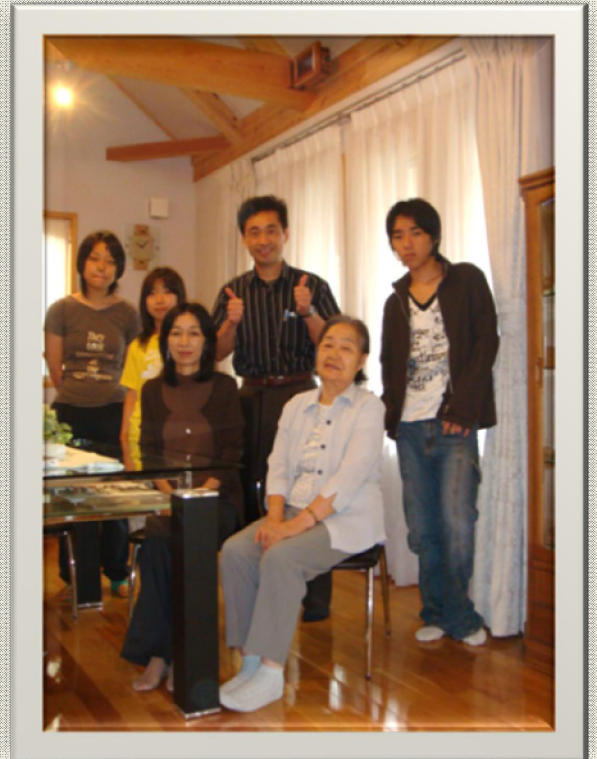
ご年配のお身体にもやさしいぬくもり